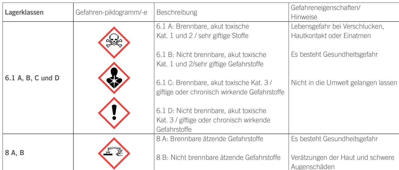
Tabelle 1: Auflistung der geführten Lagerklassen

Chemische Güter werden aufgrund ihrer chemischen Zusammensetzung in Lagerklassen nach der Technischen Richtlinie TRGS 510 eingeteilt. Folgende Lagerklassen, von denen eine Betriebsstörung/ein Störfall ausgehen könnte, führen wir auf dem Betriebsgelände: