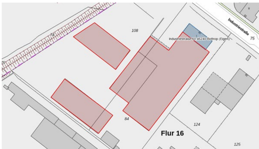
Abbildung 1: Übersicht Gefahrstoffhallen

Wir als Rhenus Port Logistics Rhein-Ruhr GmbH betreiben an Industriestraße 60 in Bottrop-Boy ein Logistiklager für Gefahrstoffe in verkehrsrechtlich zugelassenen Gebinden. Wir lagern und schlagen palettierte Produkte von Produzenten und Großhändlern um. Die Güter werden per LKW angeliefert und per Gabelstapler eingelagert. Der spätere Abruf der Paletten erfolgt ebenso per Stapler. Die Waren verlassen unser Betriebsgelände per LKW. Die zutreffenden Gefahrstoffhallen werden mit der rot schraffierten Markierung, siehe Abbildung 1, deutlich. Ergänzend bieten wir neben den logistischen Abläufen auch Sonderdienstleistungen, wie bspw. Umpack Tätigkeiten, Etikettierungen, Verzollungen, etc. an. Alle Produkte sind entsprechend den gesetzlichen Vorschriften verpackt. Die Gebindegröße liegt bei maximal 1,3 to je Gefahrstoff/-gut und maximal 2,0 to Nichtgefahren (Normale Palettenware). maximal 1,3 to je Gefahrgut und maximal 2,0 to Nichtgefahren (Normale Palettenware).